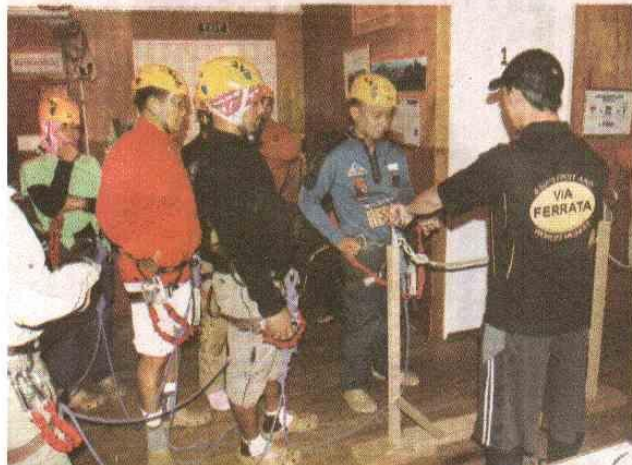
在攀爬「漫遊神山鏈」之前, 菲律賓珠穆朗瑪峰隊隊員認真聽取工作人員講解。

隨著「漫遊神山鏈」面世之後, 原是“鐵索攀岩”運動第一高的意大利多洛米迪山, 如今已經是世界第二高, 多洛米迪山高約三千三百四十三米。(010)