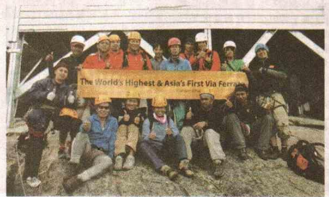
菲律賓珠穆朗瑪峰隊隊員在神山合照留念。