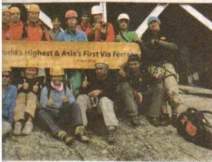
珠穆朗瑪峰隊隊員在神山合照留念。